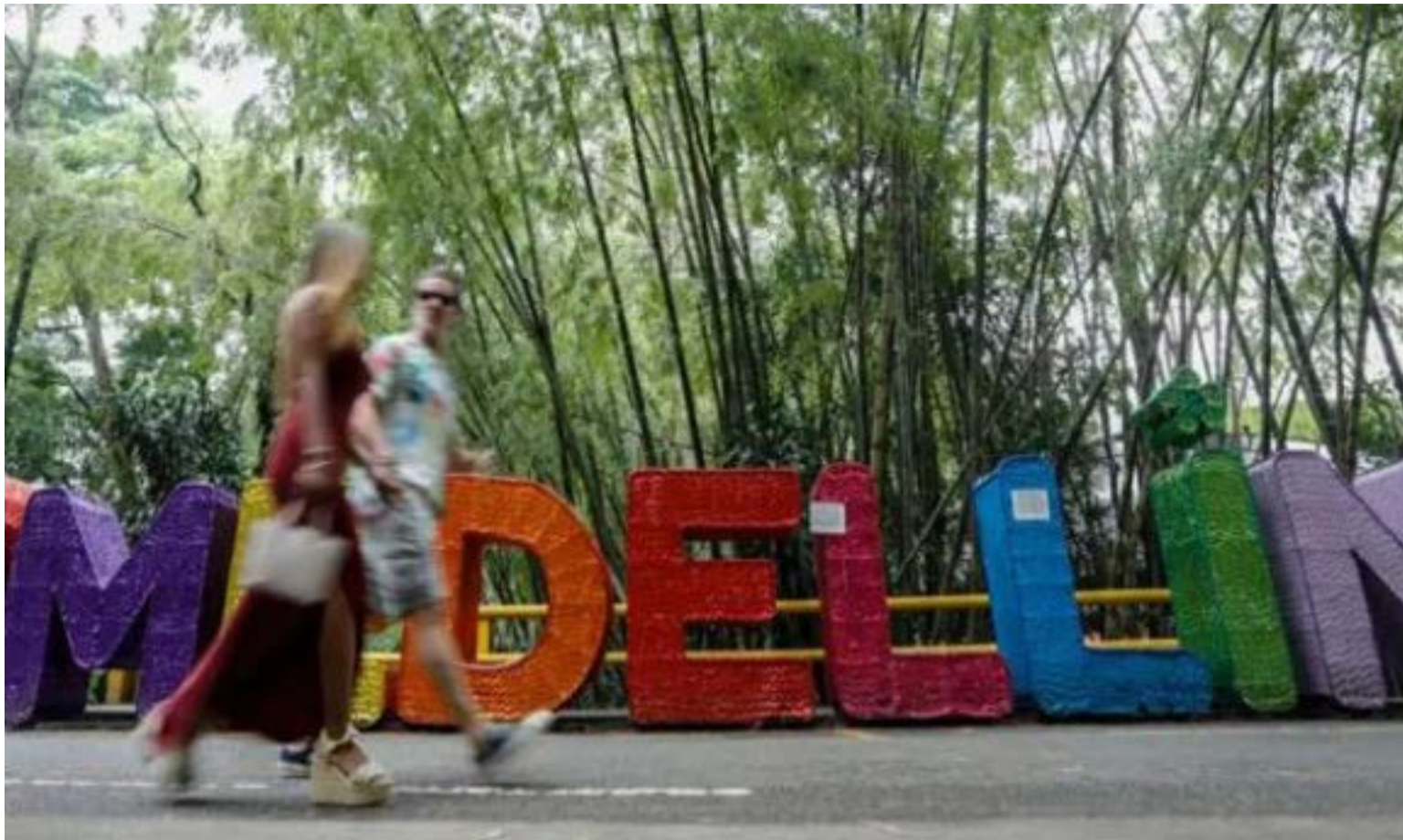
El Poblado, el exclusivo sector de Medellín que se convirtió en el epicentro del turismo sexual (y la explotación) que desborda la ciudad.