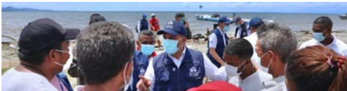
Las autoridades colombianas enfrentan un desafío creciente en el Chocó con el retorno de migrantes, gestionando un flujo humanitario que desborda las capacidades locales. Este fenómeno exige respuestas coordinadas para atender a una población en extrema vulnerabilidad.

San Andrés: De Plataforma de Tránsito a Punto de Retorno. La idílica isla caribeña, históricamente una puerta de tránsito para migrantes irregulares con destino a Norteamérica (cubanos, sudafricanos, haitianos desde 2016, y un incremento notable de venezolanos desde 2019), se ha convertido ahora también en un inesperado punto de retorno. Entre junio de 2022 y abril de 2023, la Armada Nacional rescató a 823 migrantes irregulares en sus aguas. La Procuraduría General de la Nación ha encendido las alarmas sobre la existencia de nuevas rutas de movilización, sugiriendo una posible conexión con empresas que, tras ofrecer itinerarios fallidos vía Nicaragua y México, ahora redirigen hacia