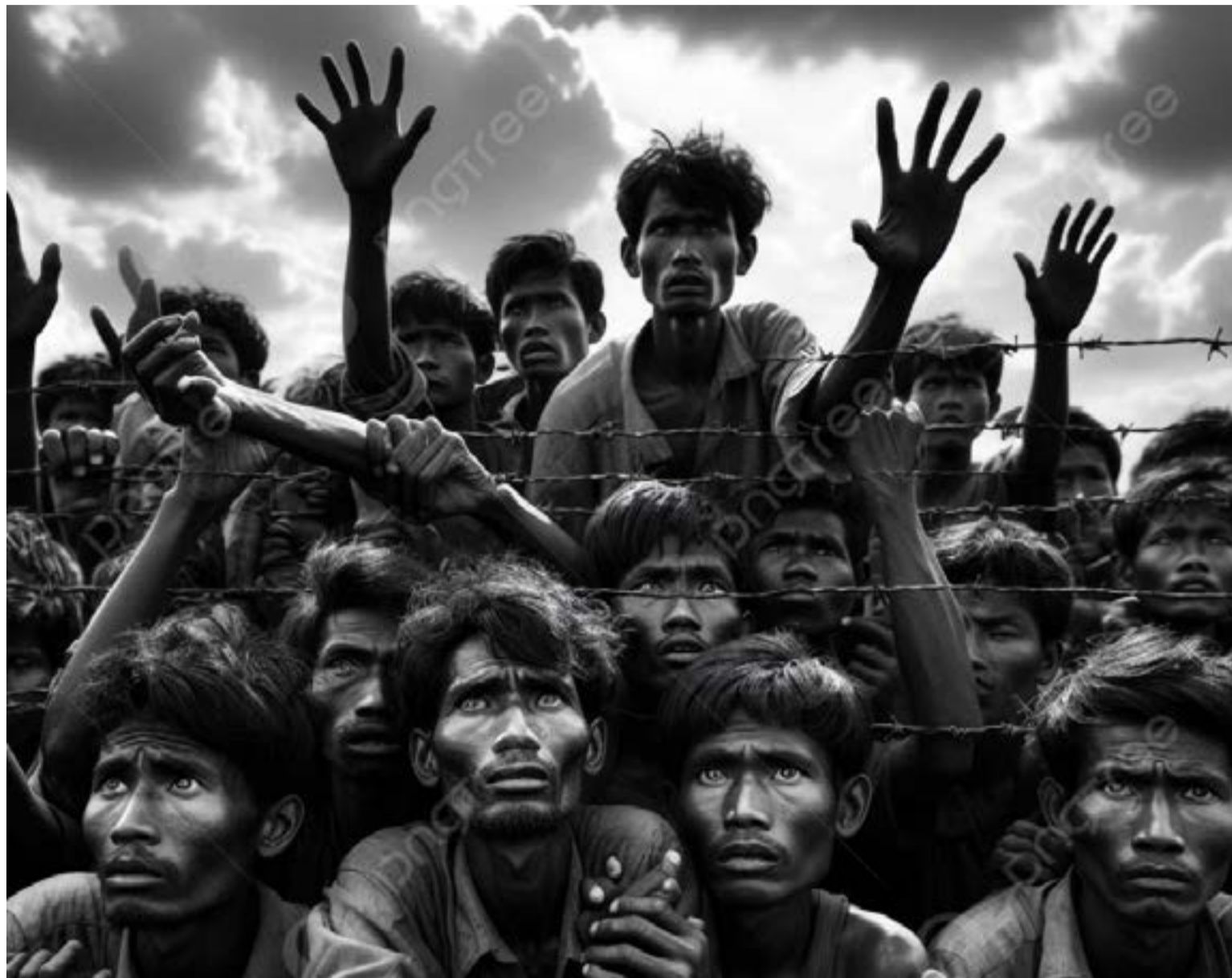
Bajo la sombra de los conflictos, expansionistas inescrupulosos se aprovechan para saquear, exterminar y robar territorios. Con el pretexto de la «democracia» o el «derecho imperial», se dan un festín, repartiéndose las tierras usurpadas, mientras los migrantes sufren.

En la actualidad, sin embargo, la migración desborda las fronteras de los países más poderosos económicamente, generando tensión, hostilidad y agresión. Mientras algunos luchan por atravesar barreras que les impiden el paso, otros alzan nuevas para mantenerlos fuera, viéndolos como un peligro para sus intereses. Este problema se ha