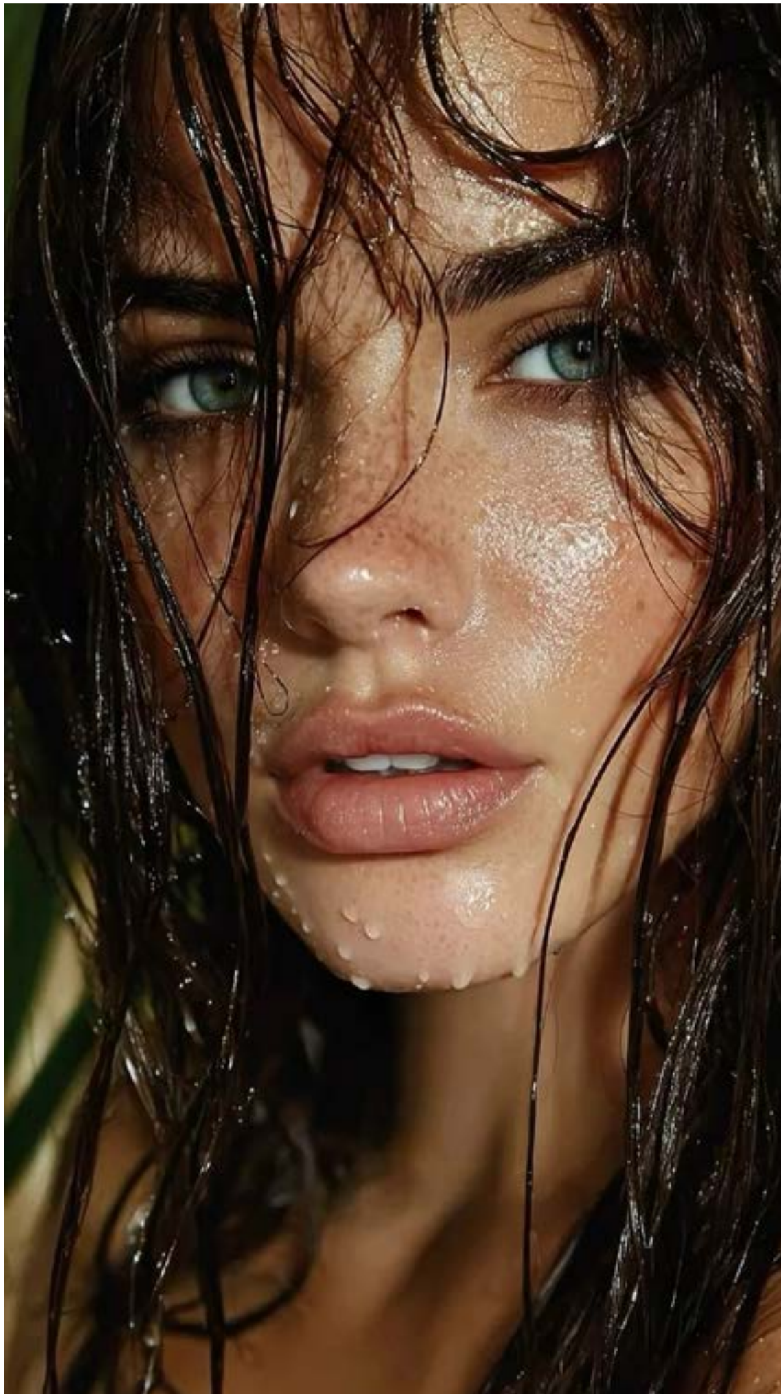
La hidratación perfecta

Éxito en el Festival de Cine Corto. Popayán se sigue consolidando como un epicentro del cine independiente en el suroccidente del país. Las producciones locales de realizadores caucanos han recibido importantes elogios de la crítica,