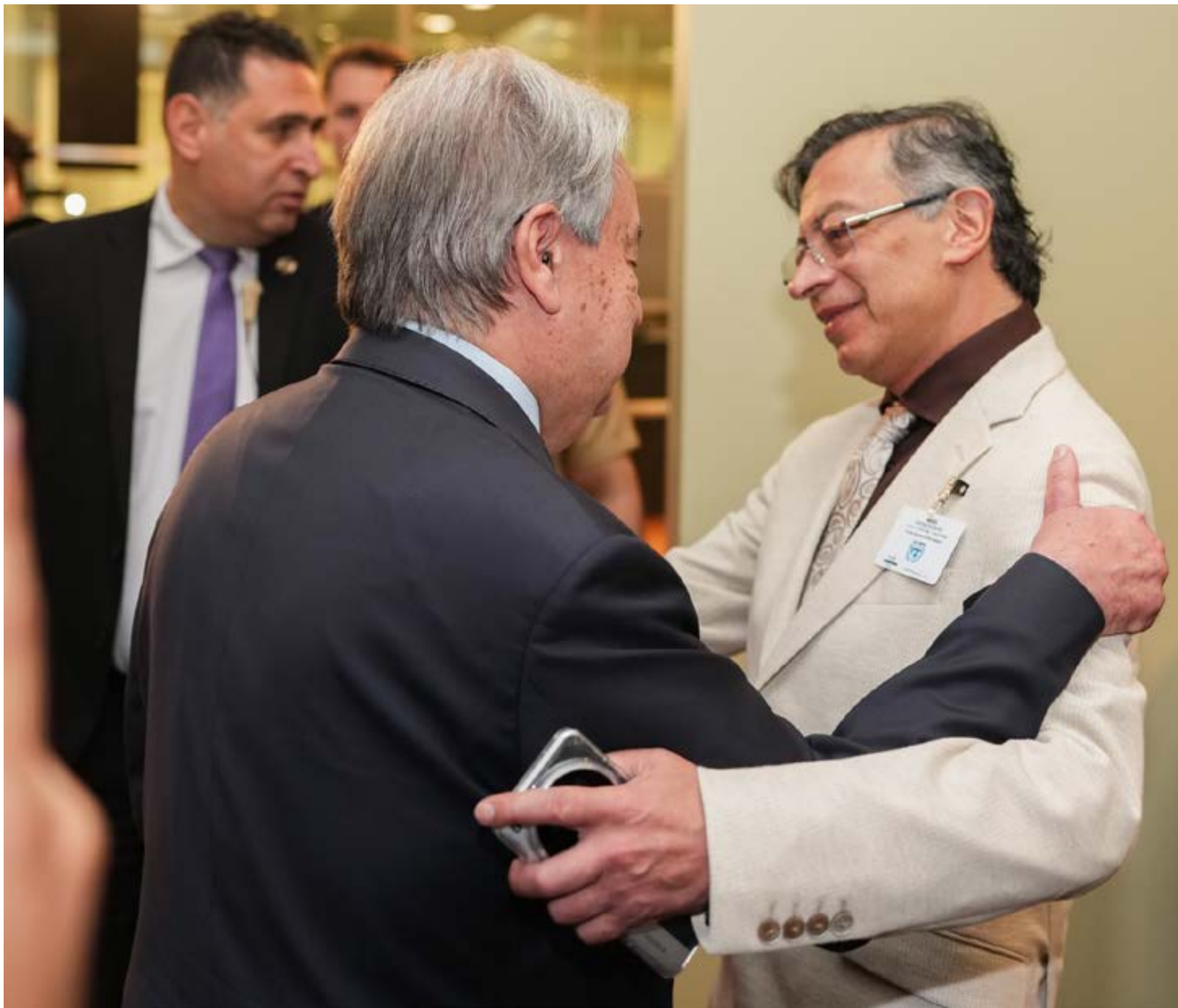
El Secretario General de la ONU, António Guterres, estuvo presente en la sesión del Consejo de Seguridad que fue presidida de forma extraordinaria por el mandatario colombiano, Gustavo Petro. En este histórico encuentro multilateral, ambos líderes abordaron de manera conjunta la urgencia de regular globalmente la inteligencia artificial y los discursos de odio.

una misma raíz: una narrativa de odio tecnológicamente amplificada.